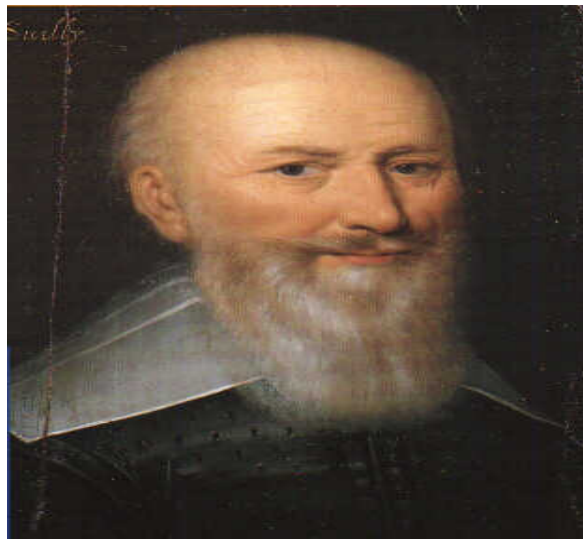
Maximilien de Béthune, 1560 - 1641

دومین طرح اتحاد اروپایی توسط ماکسیمیلیان بتونه مارشال فرانسوی بود که اروپا را در مقابل خطر امپراتوری عثمانی متحد می کرد. " گرانددسن یا طرح بزرگ " نام طرح او بود. وی طرحی فرا دولتی با ترکیب زیر ارائه داد: جمهوریهای اروپایی شامل: جمهوری های ونیز، سویس و هلند پادشاهی های انتخابی: آلمان، بوهیم، لهستان، مجارستان و واتیکان پادشاهی های موروثی: انگلیس، فرانسه، اسپانیا، سوئد، دانمارک و لمباردی این طرح اتحاد بتونه دارای پیش شرطهای قرون وسطایی دین مسیحی، زبان مشترک لاتینی، سیاست ازدواج اشراف اروپایی بود. مفاهیم جدیدی که به آن اضافه شده بود امکان جابجایی پیشه وران و هنرمندان، انتقال دانشها و علوم و فلسفه بود.