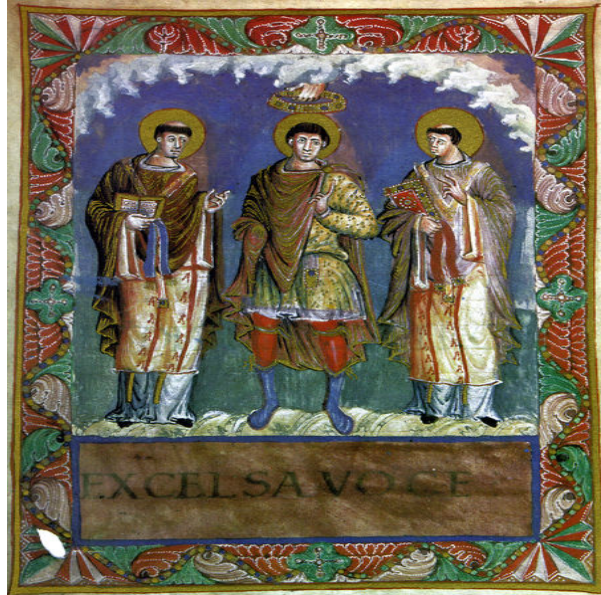
Karl the Great 742 - 814

اتحاد در اروپا همواره زمانی مطرح می شده است که نیاز تجمع نیروهای پراکنده بمنظور مقابله با قدرت روبرش بوده است. اولین طرح اتحاد اروپایی توسط شارلمانی ( کارل کبیر) در مقابل اقوام ساکسن بود که در این ایام در شرق و شمال شرقی و غربی اروپا ساکن شده و قدرت آنها رو به افزایش بود.